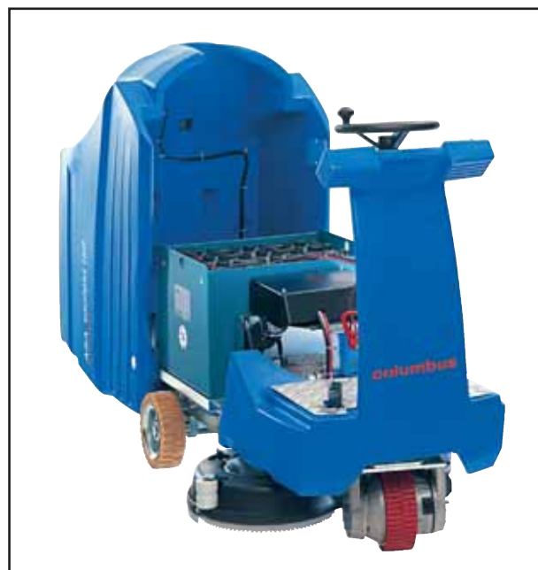
Freier Zugang zu den Maschinenkomponenten