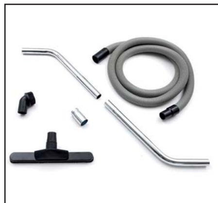
Zubehörkit „Standard“ für IDV 13