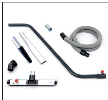
Zubehörkit „Professional“ für IDV 13