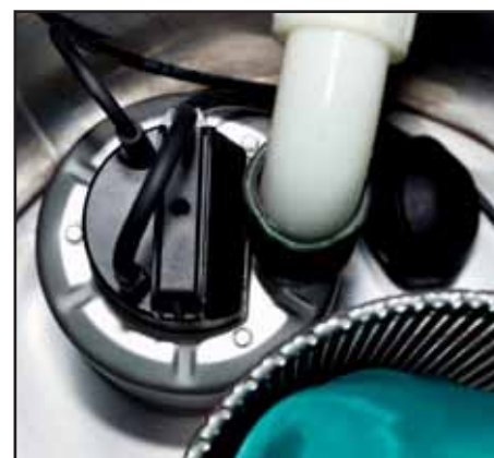
Tauchpumpe und Schwimmer