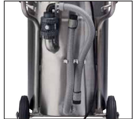
Kontrollierte Entleerung durch Ablassschlauch