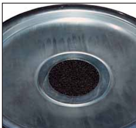
Die Saugereinheit wird durch einen speziellen Schwammfilter zusätzlich geschützt.