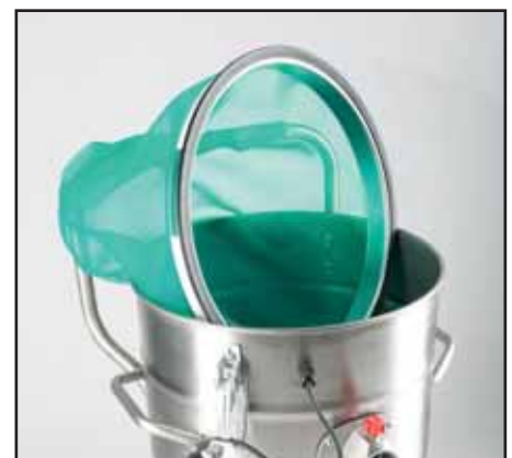
Der spezielle Nassfilter verhindert Schaumbildung und die Aufnahme von Feststoffen