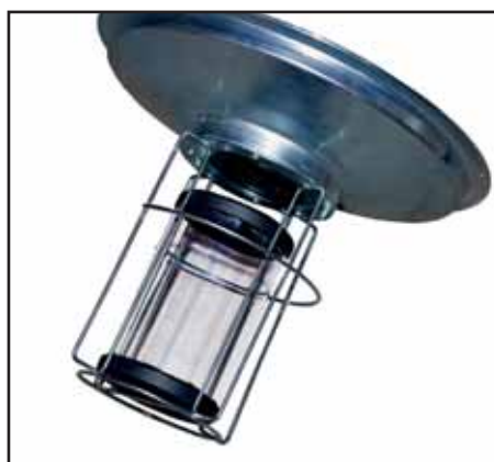
Schwimmer der Absaugeinheit