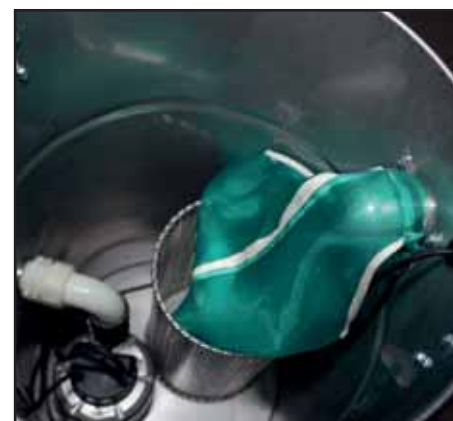
Der Polypropylen-Nassfilter verhindert Schaumbildung und Aufnahme von Fremdkörpern.