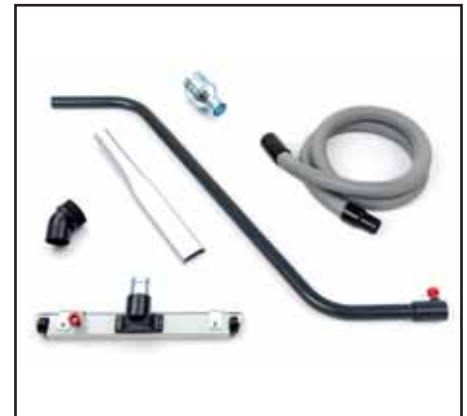
Zubehörkit für IWV 80 pump separat erhältlich