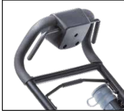
Parada rápida (Quick stop) de serie