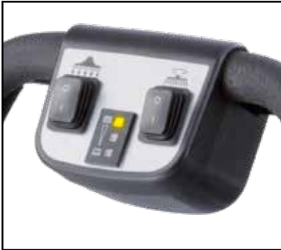
Panel de control intuitivo