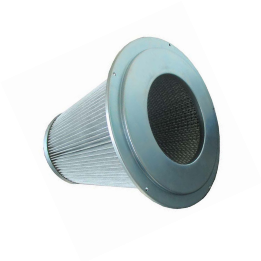
21478400 - STAUBKLASSE M PATRONEFILTER D. 340X350H