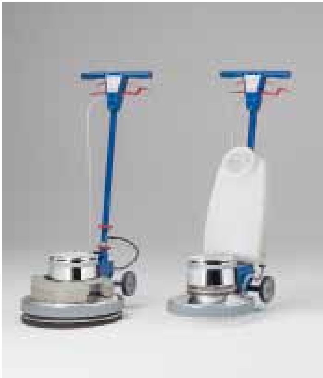
Cepillos columbus para cualquier aplicación