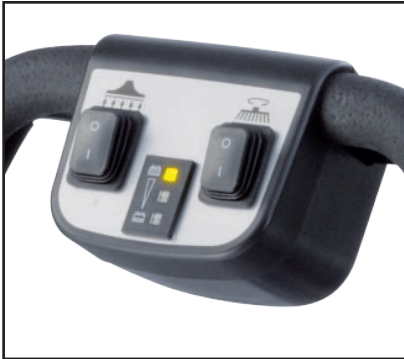
Pupitre de commande clair et intuitif