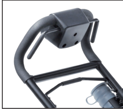
Le système Quick-Stop en série.

➤ Plus de rendement de surface: la largeur de travail de 43 cm.